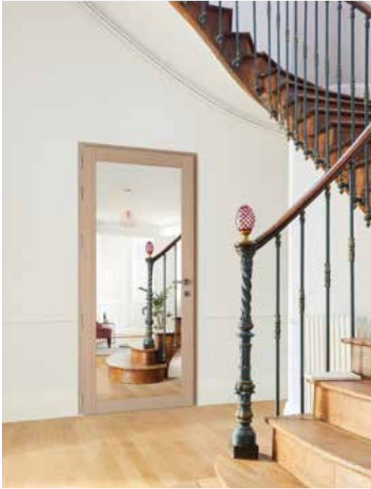
OPTION MIROIR PLEIN, finition chêne champagne