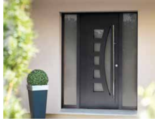
MIRAGE, fixes latéraux vitrés, couleur 2100 sablé